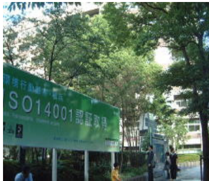
ISO取得やごみゼロを推進する施策を アピールする横浜市役所 (JR 関内駅前)

市の制度や手続き、イベントや施設に関する問い合わせ電話を外部で一括して受けるシステム。午前8時～午後9時、年中無休。市民サービスの向上と職務の効率アップをめざしています。